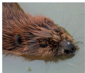
Le Castor d'Europe